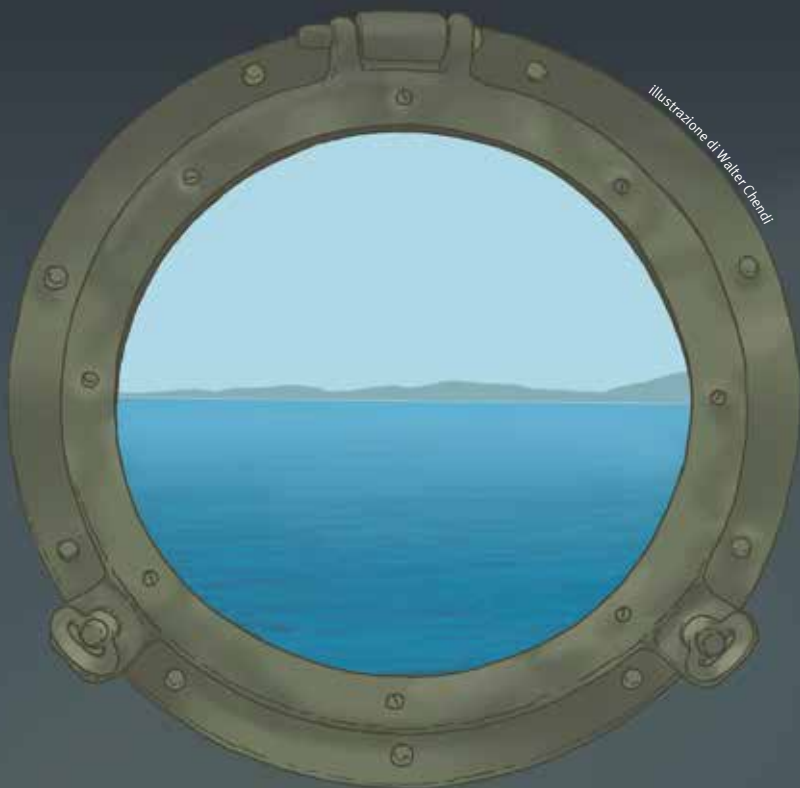
illustrazione di Walter Chendi

Porta Futuro | via Galvani 108 Roma | ingresso libero